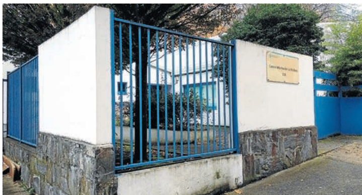
El Centro de Información a la Mujer se ubica en la calle Hortensías

Mira también pone de manifiesto la importancia de tener en cuenta las víctimas infantiles de la violencia de género; "non está interiorizado o maltrato que implica a menores", destaca. ●